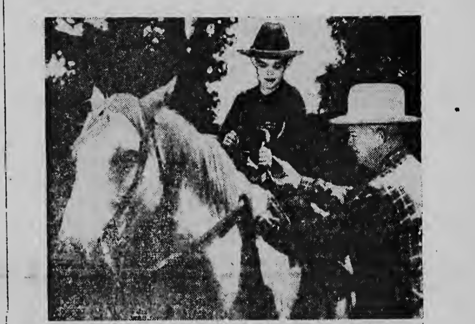
Aki President Eisenhower ta show cu su nieta di siete anja, David, como hungador di golf, piscado y corredo di caboi na un rancho den Rocky Mountains...